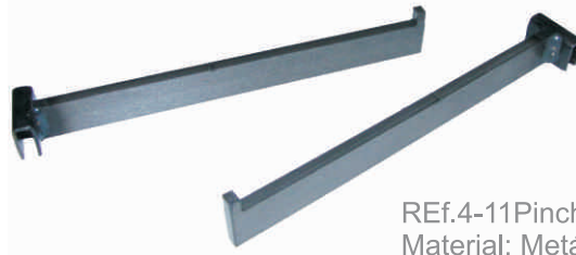
REf.4-11 Pincho barra 400 Material: Metálico pintado barniz. Precio: 4,50 €.