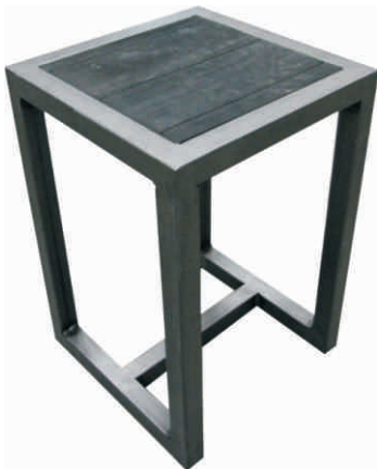
REf.16-11 Banco vestidor Material: Metálico pintado barniz sobre en resina acabado madera Precio: 60 €