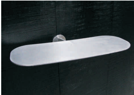
REf.012-5 Bandeja Calzado + botón Material: Acero cepillado pulido. Precio: 17 €.