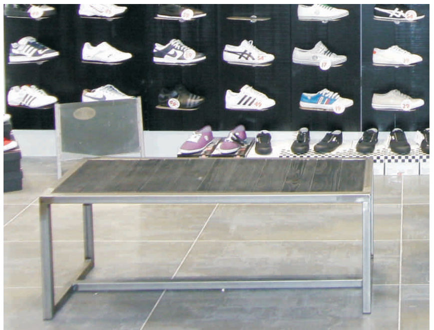
REf.10-12 Banco calzado Material: Metálico pintado barniz sobre en resina acabado madera Precio: 120 € und.