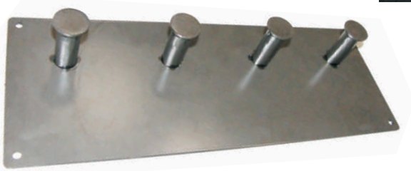
REf.029-12 Colgador probador Material: Metálico pintado barniz. Precio: 12 €