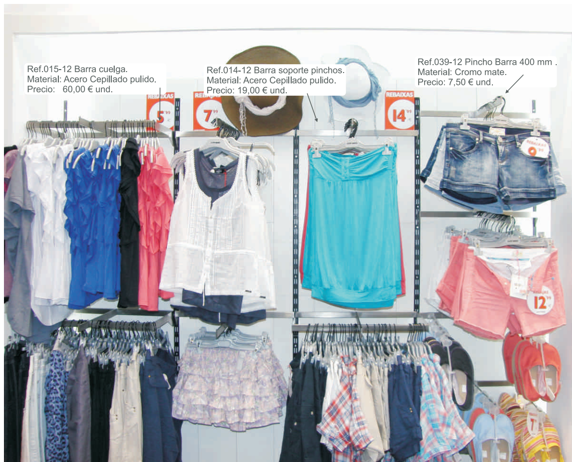
Ref.015-12 Barra cuelga. Material: Acero Cepillado pulido. Precio: 60,00 € und.