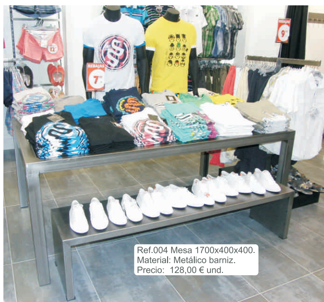
Ref.004 Mesa 1700x400x400. Material: Metálico barniz. Precio: 128,00 € und.